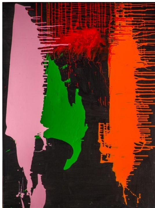
Bolest, 2023, akryl na plátně, 200 x 150 cm, soukromá sbírka