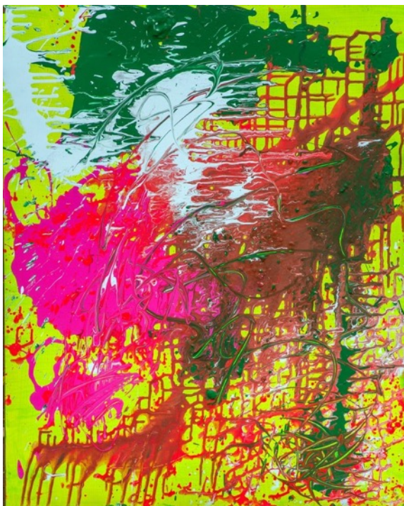
Chaos, 2023, akryl na plátně, 100 x 80 cm, soukromá sbírka

Autora jsme se rozhodli představit v plné síle v prostorách jedné z nejkrásnějších výstavních síní v Praze. Důvody jsou úspěšné zrestaurování jeho obrazů ze silného období šedesátých a sedmdesátých let či prezentace posledního Kopeckého počinu ve skle, série váz, kterou umělec zpracoval v únoru tohoto roku. Výběr z tvorby hledí Vladimíra Kopeckého ukázat především v roli malíře. K vidění jsou jeho obrazy z posledních několika let, jenž jsou charakteristické přesvědčivou silou nespoutané barevné exprese zajišťující autorovi neoddiskutovatelně místo ve světovém kontextu aktuálního malířství.